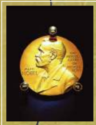
小柴名譽教授の受賞した 2002年ノーベル物理学賞