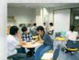
談話室では学生同士で気軽に話せます。