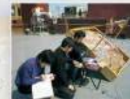
5月祭では3、4年生有志により、物理学の最近のテーマを題材にした研究発表が行われます。