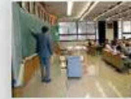
理学部4号館1220号室での講義風景です。