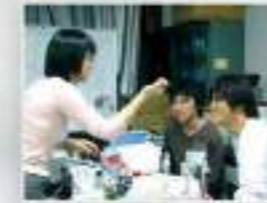
3年生の実験の授業では、物性、光、エレクトロニクス、生物実験などをおこない、物理実験の基礎を学びます。4年生になると、研究室に配属されより専門的な実験、演習をします。