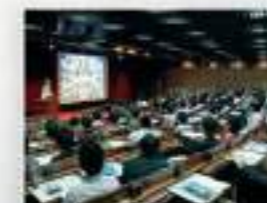
毎年6月頃のガイダンスでは大学院の志望を考えている人へのセミナーなどが開かれます。