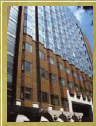
理学部一号館の正面