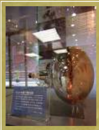
KAMIOKANDE検出器で 用いられた光センサーの実物