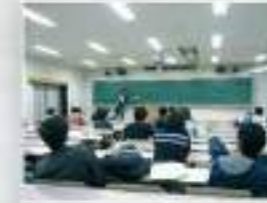
3年生の物理学演習の授業では、順番に演習問題を解きます。