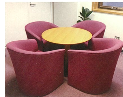
ここでご相談を伺います。

ご家族や友人、サークルや研究室の仲間などが問題を抱えていそうなときどう対応すればよいかご相談に応じます。