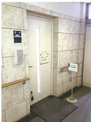
こちらが入り口です。

講義や実験・実習などの学業に関する相談や、研究環境に関する相談等については、ご本人の希望があれば理学系研究科の教員を紹介することも可能です。